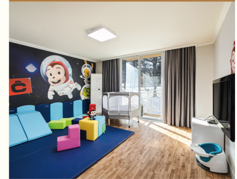
켄싱턴리조트 가평 코코몽 키즈룸