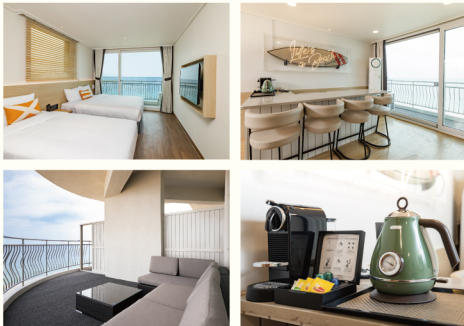
켄싱턴 로열 스위트 (35PY, 방3)

네온사인 아래 바 테이블 위에서 바다 전망을 보며 커피 한 잔의 여유를 즐길 수 있는 카페 콘셉트의 객실