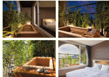
켄싱턴 디럭스 스파 (21PY, 방1)