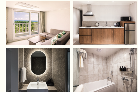
디럭스 패밀리 (25PY, 방1)