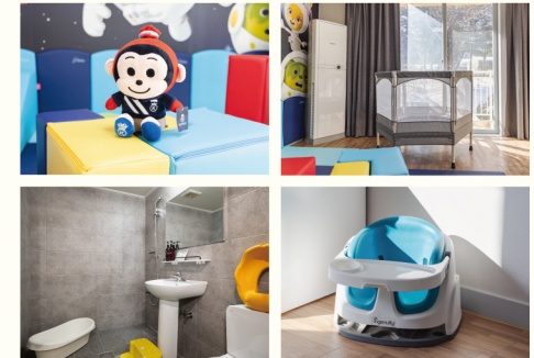
디럭스 키즈 코코몽 (21PY, 방1)