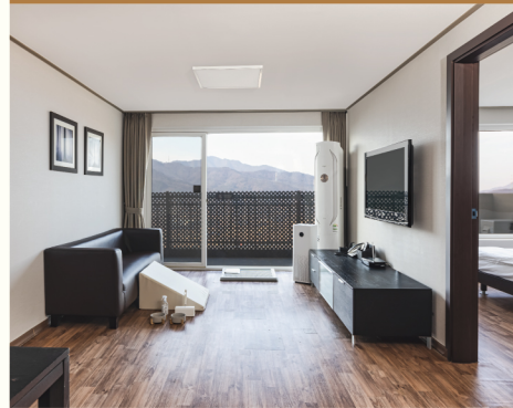
켄싱턴리조트 충주 펫 프렌들리 룸

네온사인 아래 바 테이블 위에서 바다 전망을 보며 커피 한 잔의 여유를 즐길 수 있는 카페 콘셉트의 객실