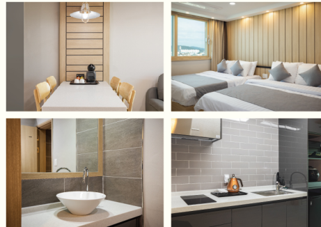
켄싱턴 디럭스 스위트 (25PY, 방1)