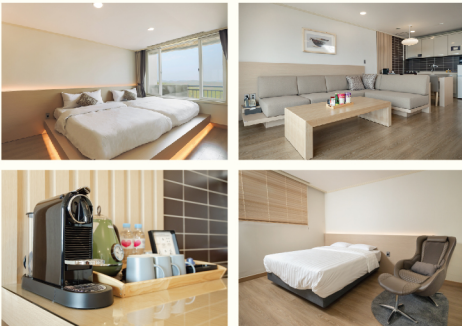
켄싱턴 그랜드 (31PY, 방2)