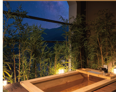
켄싱턴리조트 지리산하동 별빛 감성 스파 룸

반려동물이 맘껏 뛰놀 수 있는 넓은 객실로 특별한 추억을 남기기 적합한 펫 객실