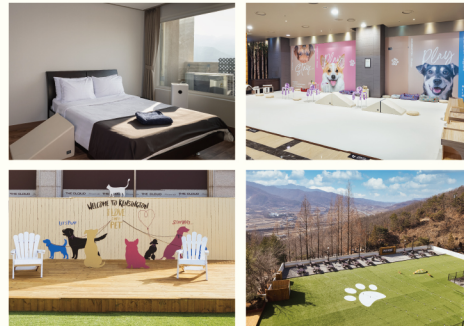
켄싱턴 로열 스위트 펫 (35PY, 방3)

반려동물이 맘껏 뛰놀 수 있는 넓은 객실로 특별한 추억을 남기기 적합한 펫 객실