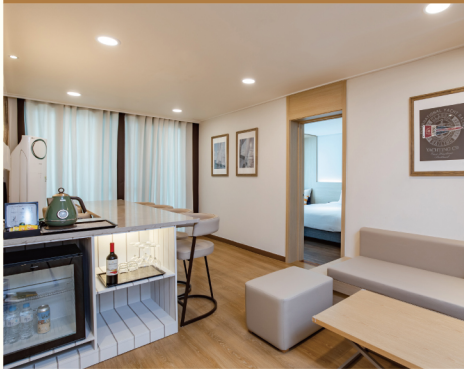
켄싱턴리조트 설악비치 카페 인 더 룸

ALL NEW KENSINGTON , 고객의 목소리로 완전히 새롭게 달라진 켄싱턴을 만나보세요.