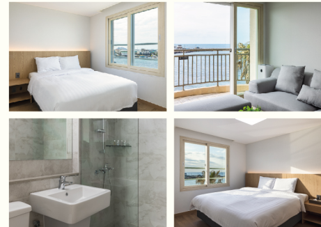
켄싱턴 로열 스위트 (35PY, 방3)

한라산과 에메랄드 제주 바다가 보이는 6명의 대가족도 수용 가능한 넓은 객실