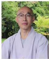
무문sun 화암사 부주지님

이야기 '내 안의 고요를 말하다' TALK 고성에서의 삶, 요가하는 삶, 10. 7. 토 수련하는 삶에 대한 미니 토크 콘서트 13 : 30 금강산화암사 종무소 앞